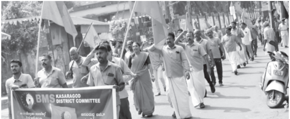
ബി.എം.എസ്. കാസർഗോഡ് ജില്ലാ സമിതി സംഘടിപ്പിച്ച പ്രതിഷേധ മാർച്ച്.

നെടുമങ്ങാട് : നെടുമങ്ങാട് താലൂക്ക് ഓഫീസിനു മുമ്പിൽ നടന്ന പരിപാടി ഫെറ്റോ