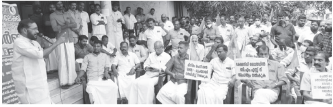
തൃശ്ശൂർ ജില്ലാ ടോഡി ആൻഡ് അബ്കാരി മസ്ദൂർ സംഘത്തിന്റെ ആഭിമുഖ്യത്തിൽ ചെത്ത് തൊഴിലാളി ക്ഷേമ നിധി ഓഫീസിന് മുന്നിൽ നടത്തിയ ധർണ്ണ സേതു തിരുവെങ്കിടം ഉദ്ഘാടനം ചെയ്യുന്നു.