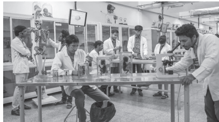
ഇഎസ്ഐ കോർപ്പറേഷൻ കാലാകാലങ്ങളിൽ നിഷ്കർഷിക്കുന്ന യോഗ്യതയുള്ള പരിരക്ഷിത വ്യക്തിയുടെ മക്കൾക്ക് നീറ്റ് റാങ്കിന്റെ അടിസ്ഥാനത്തിൽ ഇഎസ്ഐ മെഡിക്കൽ കോളേജുകളിൽ പ്രവേശനം ലഭിക്കുന്നതായിരിക്കും.

c) ESI ബ്രാഞ്ച് ഓഫീസുമായി ബന്ധപ്പെട്ട സാമ്പത്തിക ആനുകൂല്യങ്ങൾ സംബന്ധിച്ച പരാതികൾ തൃശൂർ റീജിയണൽ ഓഫീസ്, എറണാകുളം സബ് റീജിയണൽ ഓഫീസ്, കൊല്ലം സബ് റീജിയണൽ ഓഫീസ്, തിരുവനന്തപുരം സബ് റീജിയണൽ ഓഫീസ്,