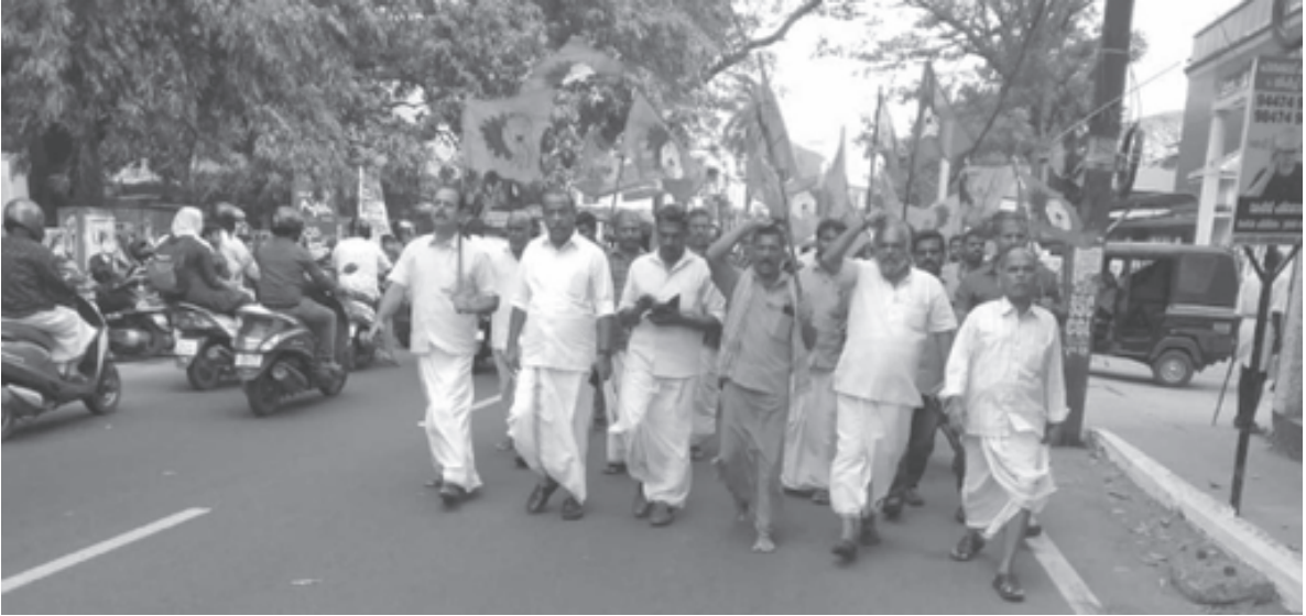
. പാലക്കാട് ജില്ലാ പ്രൈവറ്റ് ബസ്സ് & ഹെവി വെഹിക്കിൾസ് മസ്ദൂർ സംഘത്തിന്റെ ആഭിമുഖ്യത്തിൽ നടന്ന പ്രതിഷേധ പ്രകടനം